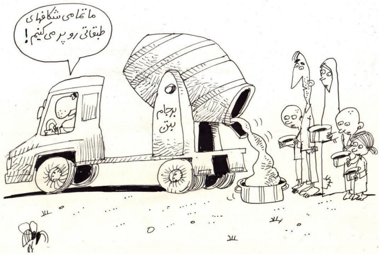
پر کردن شکاف طبقاتی در پسابر جام!